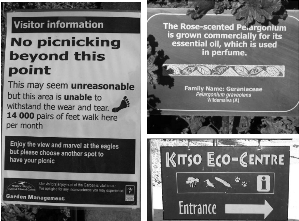
Figuur 4: Verbeterde inligtingsborde.

Aangeplante tuine wat in 1995 swak gevaar het tydens die voorkeurgebiede-studie het aandag geniet en veral die vetplanttuin is aansienlik uitgebrei en vernuwe. Ander tuine wat nuut aangelê is en wat nie op die uitlegkaart wat tans gebruik word aangedui word nie, sluit die vlinder- en voëltuin in wat tipiese plante bevat wat bekend is om vlinders en voëls na tuine te lok. Daar is ook 'n nuwe geologiese tuin en geologiese roete aangelê wat die interessante geologiese formasies van die omgewing op 'n inligtingspamflet aandui (Figuur 5).