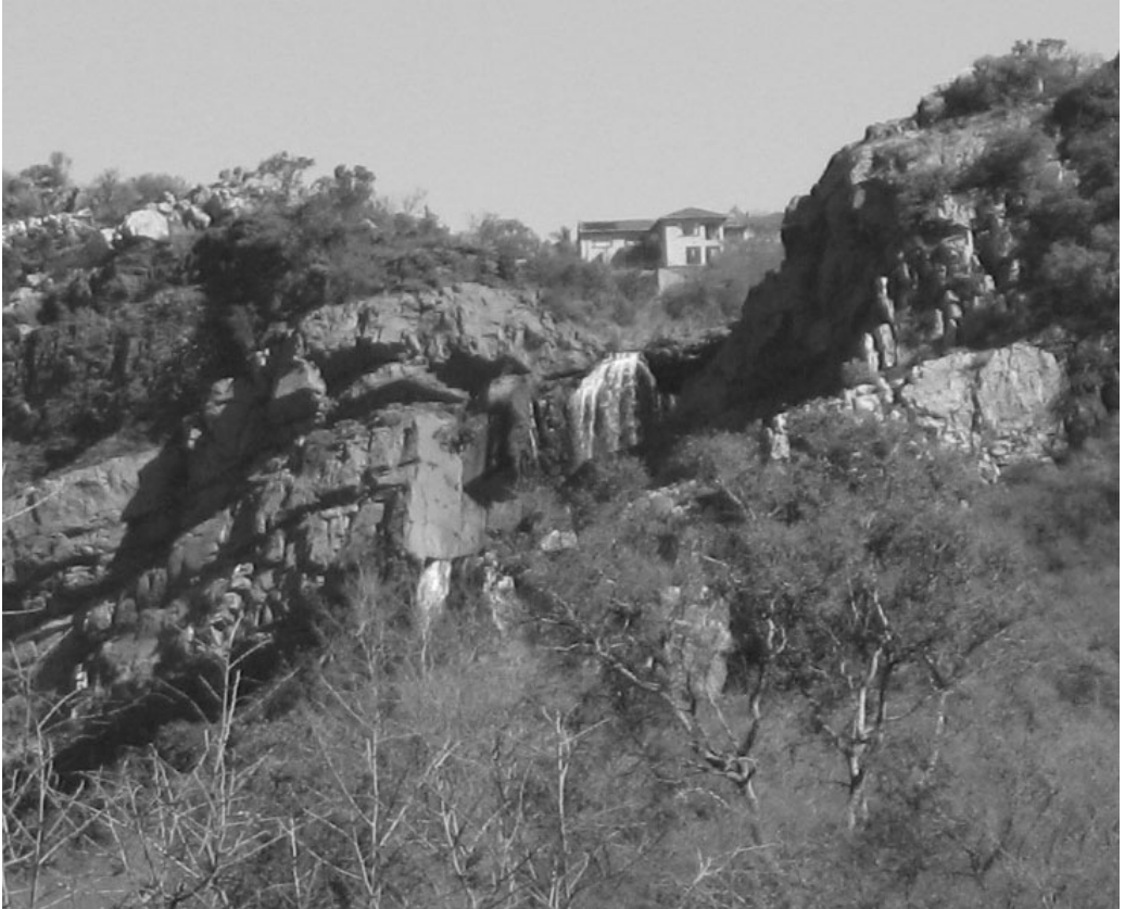
Figuur 6: Ontwikkeling wat afbreuk doen aan die tuin se estetiese waarde.

Hierdie artikel poog nie om die aanname te maak dat alle verbeteringe aan die tuin as gevolg van die 1995-aanbevelings gemaak is nie, maar gee erkenning aan die feit dat opgraderings afhanklik is van finansiële en menslike hulpbronne, asook dat dit 'n voortdurende uitvloeisel is van die assessering van aantreklikhede. Wat die artikel wel poog om aan te dui, is dat verbeteringe wat gemaak is, ooreenkom met aanbevelings wat gemaak was en dat vernuwing en hernude belangstelling in aantreklikhede sodoende verseker kan word.