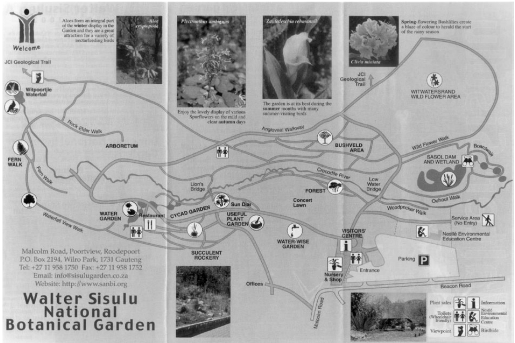
Figuur 2: Uitlegkaart wat tans gebruik word.

Die uitlegkaart is verbeter met betrekking tot die hoeveelheid inligting wat weerspieël word, en foto's en beskrywings wat besoekers in verskillende areas kan verwag, word aangedui. Bewaringsbeginsels maak ook deel uit van die inligting wat op die kaart aangedui word.