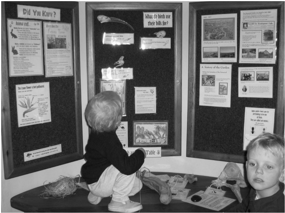
Figuur 3: Die Kitso Eco-centre se vat-en-voel tafel.

natuurlik voorkom, is daar volgens Willis en Morkel (2007) ook 240 voël-, 25 soogdier-, 25 reptiel-, 7 amfibiese, 73 skoelapper- en 70 spinnekopsesies in die WSBT geïdentifiseer. Die trots van die WSBT bly steeds die witkruisarend-broeipaar. Tydens die studie in 1995 het dit aan die lig gekom dat die witkruisarend-broeipaar 'n broeiplek gebruik wat sedert 1940 deur witkruisarende gebruik word, maar dat die voortbestaan van die arende in hierdie stedelike gebied bedreig word en dat die tuin nie voldoende aandag aan die arende skenk nie. Die vrywilligers van die witkruisarend-monitoringsgroep het spesifiek kommer uitgespreek oor die gebruik wat bestaan het om klassieke musiekkonserte op die grasperk voor die watervalpoel aan te bied. Die tuin bied steeds die konserte aan, maar 'n amfiteater is vir hierdie doel gebou op die konsertgrasperk, soos op die uitlegkaart aangedui. Sodoende is die steurnis vir die arende drasties verminder. Die witkruisarende word steeds gemonitor, tans deur die Black Eagle Project (2003) van Roodekrans. Sedertdien is bemande teleskope ook aangebring waardeur die besoekers die arende op hulle neste kan beskou. Die arende het twee neste wat hulle afwisselend gebruik en inligting oor die arende se gewoontes, huidige broeistatus en algemene welstand word deur een van die vrywilligers van die Black Eagle Project aan die besoekers verskaf. Ander vrae wat besoekers mag hê, word ook beantwoord.